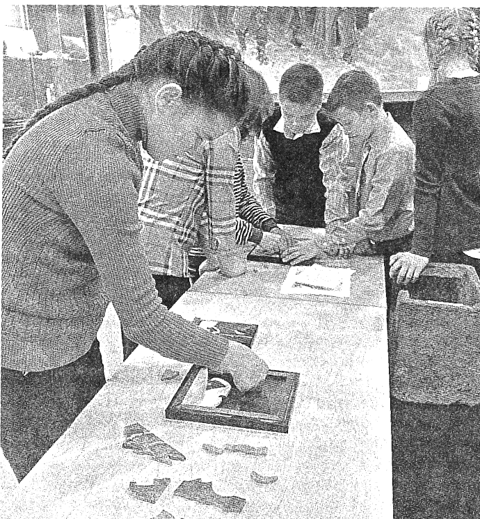
От желающих собирать каменную мозаику нет отбоя.

уровня с двухсотлетней историей. Это – громадный социальный, культурный потенциал. Как сделать так, чтобы уникальное село развивалось, причем с участием местной молодежи? Стало желанным местом, куда вчерашние дети возвращаются не отдыхать, а жить и работать? Мы решили: только через лич-