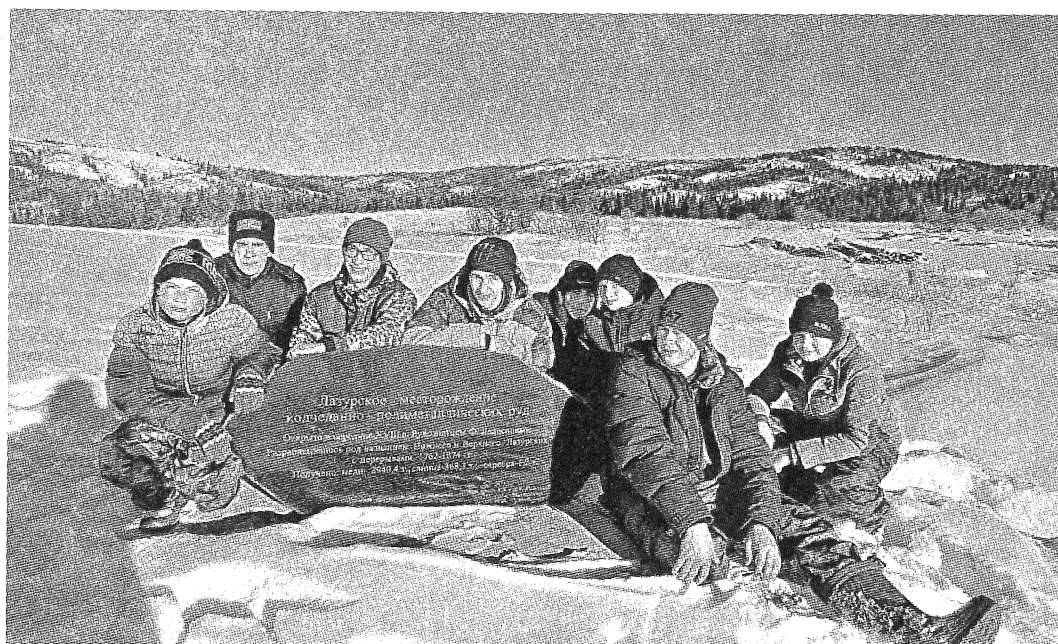
Участники экспедиции на Лазурском месторождении.